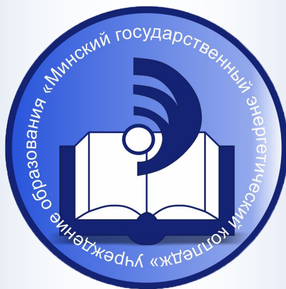
ГРАФИК ПОВЫШЕНИЯ КВАЛИФИКАЦИИ И ПЕРЕПОДГОТОВКИ КАДРОВ НА 2025 ГОД

Министерство энергетики Республики Беларусь Государственное производственное объединение электроэнергетики «БЕЛЭНЕРГО» Учреждение образования «Минский государственный энергетический колледж»